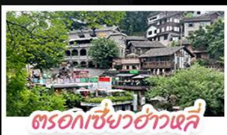
ตรอกเซียวฮ่าวเหล่