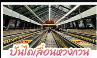
บันไดเลื่อนแขวงกวน