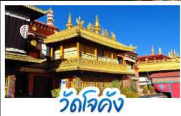
วัดโจคัง