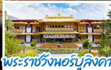
พระราชวังเนอร์บูลิงคา