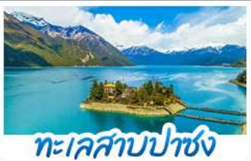
ทะเลสาบปาซง

04 - 11 พ.ค. 69 53,888 11 - 18 พ.ค. 69 53,888 18 - 25 พ.ค. 69 52,888 25 พ.ค. - 1 มิ.ย. 69 52,888