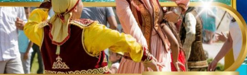
Huns Ethno Village