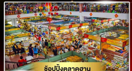
ช้อปปิ้งตลาดฮาน