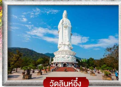
วัดลินห์อึ้ง