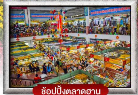
ซ้อปั้งตลาดฮาน