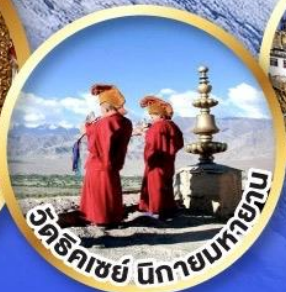
วัดริคเชย์ นิกายมหายาน