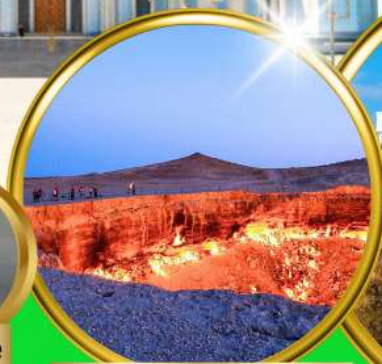
Darvaza Gate To Hell