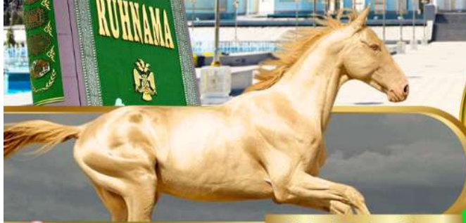
Akhal Teke Horse