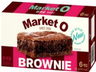
Market O Real Brownie (20g x 6cookie)