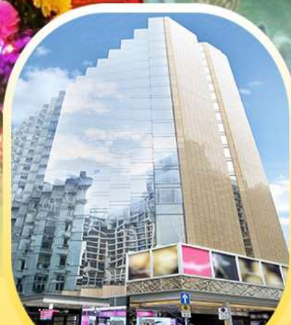
THE KOWLOON HOTEL TSIM SHA TSUI