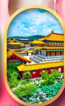
เมืองจำลองสามก๊ก