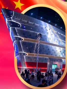
เรืออะทลันติก