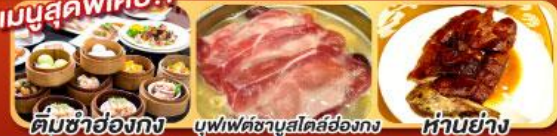
ต้มชาฮ้องกิง บุฟเฟ่ต์ชาบูสโด้ฮ้องกิง ห่านย่าง