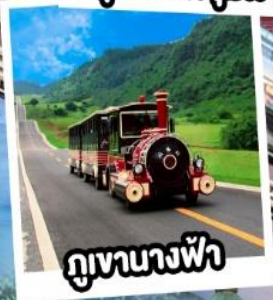
ภูเขาฉางฟ้า