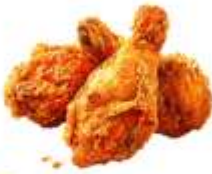
● ไก่ทานสัตว์ปีก (ไก่)