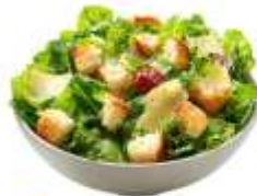
● ภัตตาคาร