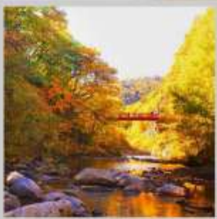
"JOZANKEI FUTAMI BRIDGE"