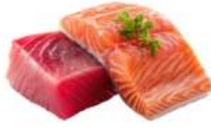
● ไก่ทานปลาดิบ