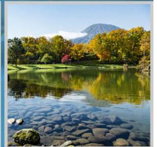
"FUKIDASHI PARK+MT. YOTEI"