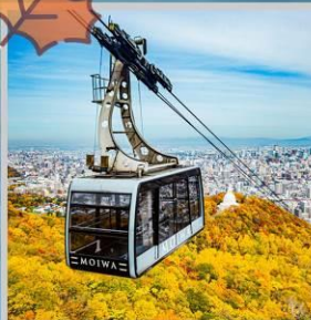
"MT. MOIWA ROPEWAY"