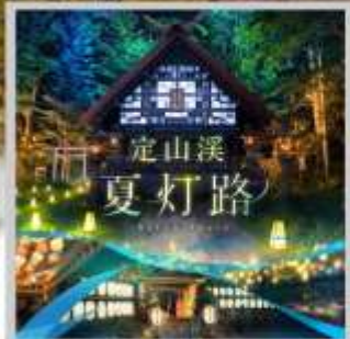
"JOZANKEI NATSU TOURO 2026"