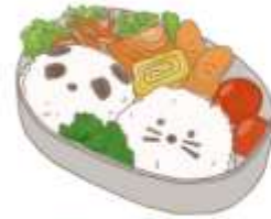
● อาหารสำหรับเด็ก ( 2-11 ปี ) *วัตถุดิบขึ้นอยู่กับทาว์น