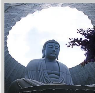
“HILL OF BUDDHA”

“ ชมใบไม้เปลี่ยนสีที่สะพานฟุตามิ ” สะพานสีแดงที่ทอดข้ามแม่น้ำโทโยอิระท่ามกลางใบไม้เปลี่ยนสี ชมใบไม้เปลี่ยนสี “ ถนนต้นแปะทิว ณ มหาวิทยาลัยฮอกไกโด ” ทั้งสองข้างทางความยาวกว่า 380 เมตร สัมผัสแหล่งน้ำแร่บริสุทธิ์ 1 ใน 100 ของประเทศญี่ปุ่น ณ “ สวนน้ำแร่ฟุกิดาชิ ” ชม “ เนินพระพุทธรเจ้า ” ความงดงามของใบไม้เปลี่ยนสีที่ซ่อนอยู่กลางธรรมชาติของฮอกไกโด สัมผัสน้ำพุร้อนที่เกิดขึ้นเองตามธรรมชาติ ณ “ หุบเขารกโนโบริเบ็ทสึ ” เมืองน้ำแร่ที่มีชื่อเสียงที่สุดของเกาะฮอกไกโด ชมวิวกูเงาอันน่าทึ่งของเกาะฮอกไกโดด้วยการ “ นั่งกระเช้าลอยฟ้าภูเขาโมอิวะ ” อันน่าตื่นตะลึงไปด้านบน