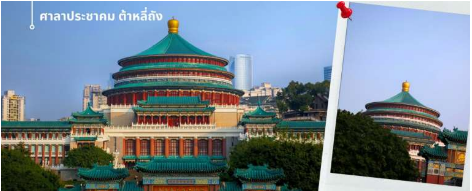
เดินชมแสงไฟยามค่ำคืน จัดนิทรรศการต่างๆ

นำท่านเดินทางสู่ ศาลาประชาชน (ด้านนอก) เป็นสถานที่หนึ่งในสัญลักษณ์ของเมืองฉงชิ่ง ด้วยสีส้มและรูปแบบการจัดวางอย่างโดดเด่นและลงตัว มีการผสมผสานของศิลปะในยุคราชวงศ์หมิงและราชวงศ์ชิงเข้าไว้ด้วยกัน ด้านหน้าจะเป็นลานกว้าง ในตอนเย็นและตอนกลางคืนจะมีผู้คนจำนวนมากเข้ามารวมตัวกันทำกิจกรรม ไม่ว่าจะเป็นการเต้นแอโรบิก เดินเล่น ปิกนิก