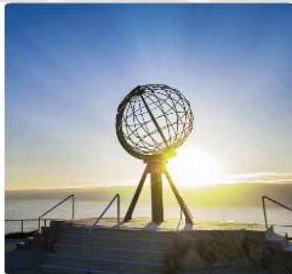
สัมผัสดินแดนไวคิง ชมพระอาทิตย์เที่ยงคืน