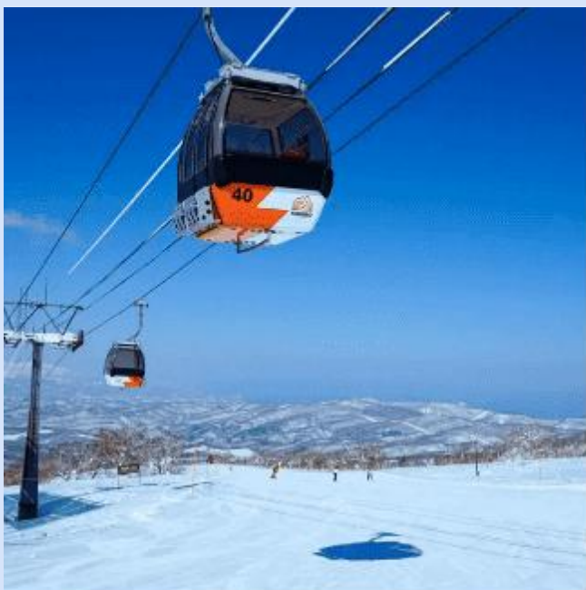
KIRORO SKI RESORT

นำท่านเดินทางสู่ KIRORO SKI RESORT อีสาระให้ท่านเล่นกิจกรรม ณ ลานสกี KIRORO SKI RESORT ตามอัตราด้วย (ไม่รวมค่าเช่า ชุดกันหนาว และอุปกรณ์เครื่องเล่น) ที่มีกิจกรรมทางหิมะให้ท่านเลือกเล่นมากมายไม่ว่าจะเป็น Sled ที่ไหลลงจากเนินสูง ลาน Snow Park ให้เด็ก ๆ เล่นปั้นหิมะ ปาหิมะ ต่อด้วยการนั่ง Snow Raft เรือล่องแก่ง Banana Boat ที่ลากด้วยสโนว์โมบิล ขับรถเลื่อนบนหิมะด้วย Mini Snowmobile อาจจะมันส์ขึ้นไปอีกต้องไปขี่รถ ATV Snow Buggy วิ่งไปบนหิมะหนา ๆ นอกจากนี้ยังมีบริการให้ขับรถสองล้อ Snow Segway และปั่นจักรยานท่าหิมะอีกด้วย หรือจะไปที่ สถานี Gondola/Chair Lift (ไม่รวมค่ากระเช้า) ที่อยู่ด้านข้างโรงแรมเพื่อไปยังยอดเขาด้านบน เพื่อไป สังระขังแห่งความรัก Nisa Bell หรือ Lover's Bell ระขังชื่อดังของยอดเขา Asari **หมายเหตุ การเปิดให้บริการของ gondolacabin ขึ้นอยู่กับกำหนดการเปิดปิดของลานสกีและสภาพอากาศ ณ วันเดินทาง**