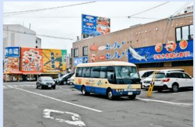
SAPPORO JOGAI MARKET