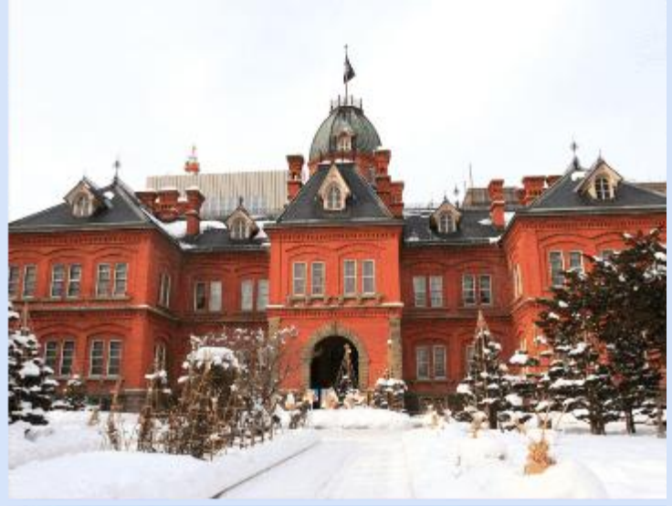
FORMER HOKKAIDO GOVERNMENT OFFICE