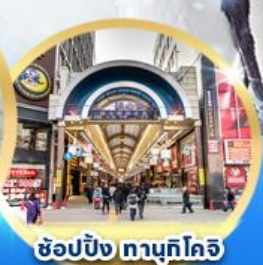
ช้อปปิ้ง ถนนซูทโคจิ