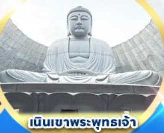
เนินเขาพระพุทธรเจ้า