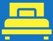
ห้องพักเดี่ยว SINGLE

ตัวอย่างประเภทห้องพัก *เป็นเพียงตัวอย่างเพื่อให้เห็นภาพสำหรับประเภทห้องในแบบต่างๆ