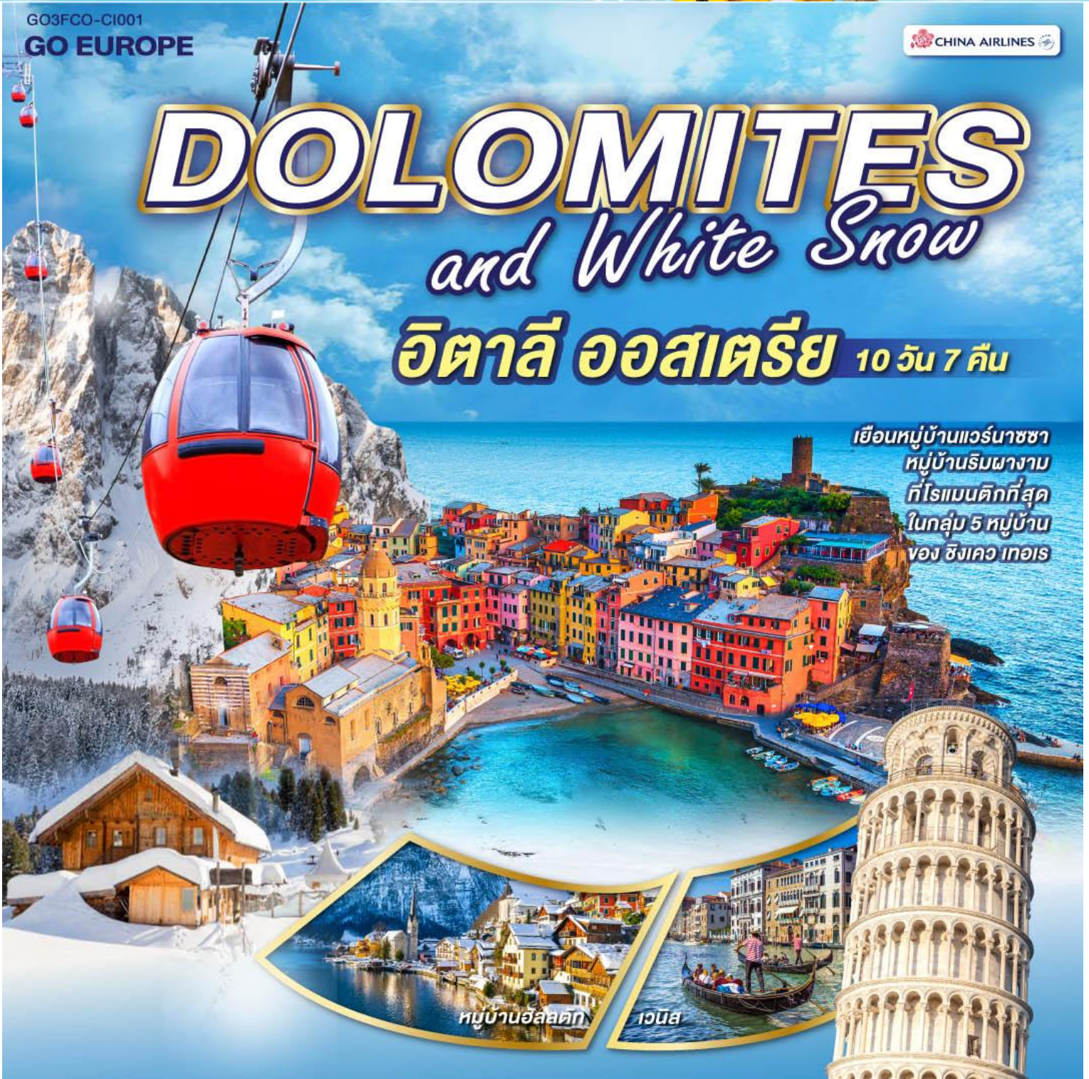
หมู่บ้านฮัลลสตัดท์

เยือนหมู่บ้านแวร์นาชชา หมู่บ้านริมผางาม ที่โรแมนติกที่สุด ในกลุ่ม 5 หมู่บ้าน ของ ซังควา เทอริ