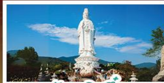
วัดเซ็กินอึ้ง