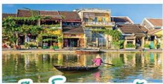
เมืองโบราณเฮอจอัน

! พบกับเขานาฮิลล์ 1 คืน ! สัมผัสอากาศเขตร้อนชื้น สตรีฟรังเศสสุดคลาสสิก - นั่งกระเช้ายาวที่สุด สูบานาฮิลล์ สนุกสุดมันส์ไปกับสวนสนุก The Fantasy Park นมัสการเจ้าแม่กวนอิมองค์ใหญ่ที่สุดของเมืองดานัง - ศึกษามรดกโลกฮอยอัน - สนุกสนานไปกับกิจกรรม!! นั่งเรือกระด้ง หมู่บ้านกัมทาน เช็คอินร้านกาแฟ SON TRA MARINA CAFE - ไม่ลงร้านช้อปปิ้ง - อิ่มอร่อยกับบุฟเฟ่ต์นานาชาติ , หม้อไฟซีฟู้ด