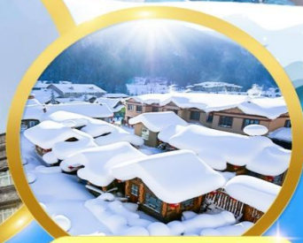
หมู่บ้านหิมะ-HARBIN