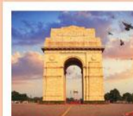
♡♡ India Gate