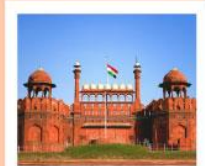
♡♡ Agra Fort