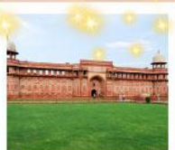
Ajmer Sharif Dargah