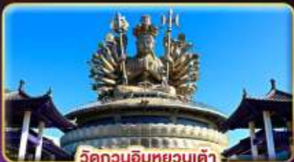
วัดกวนอิมหยวนเต้า