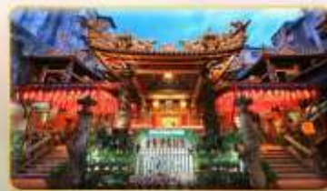
วัดเทียนฮั่ว ของพระเจ้าแม่มาจู่