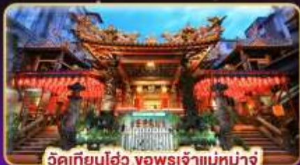
วัดเทียนโฮ่ว จอพรเจ้าแม่ท้าวจู