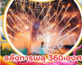
อสังการพลุ 360 องศา