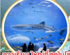
อควาเรียมใหญ่ที่สุดในโลก