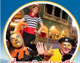
เที่ยวอนิเมะแห่งเอเชีย