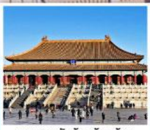
พระราชวังต้องห้ามปักกิ่ง