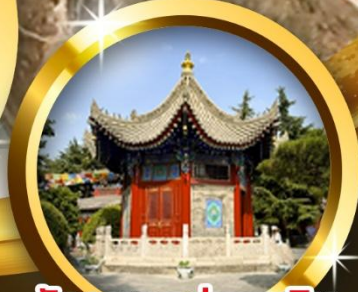
วัดลามะกว้างเหริน