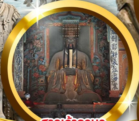
ศาลเจ้ากวนอู