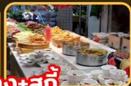
เปิดอย่าง+สุกั