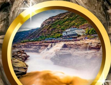
น้ำตกหูโข่ว