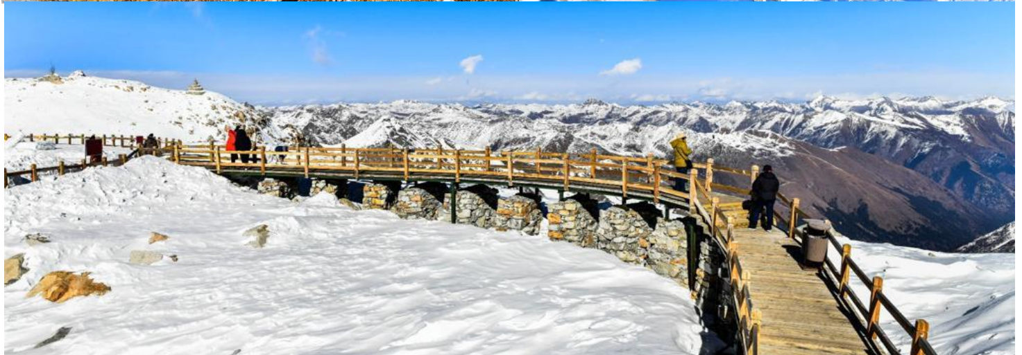
กาแฟพร้อมชมวิวยุทธหิมะรอบด้าน