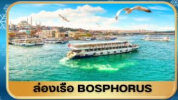
ล่องเรือ BOSPHORUS