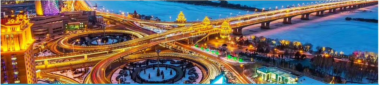
นครฮาร์บิน