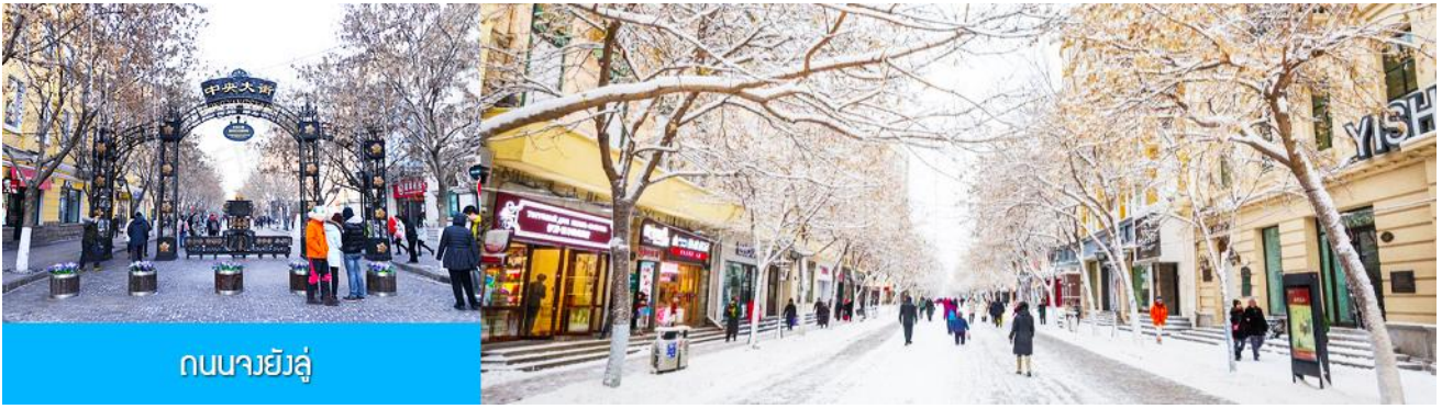
ถนนจางยี่จู่

จากนั้นนำท่านเที่ยวชม ถนนจางยี่จู่ 中央大街 ถนนสายหลักของเมืองฮาร์บิน ถนนที่เต็มไปด้วยอาคารบ้านเรือนที่เป็นสถาปัตยกรรมตะวันตกที่สร้างในช่วงคริสต์ศตวรรษที่ 18 – 19 ที่เมืองนี้ถูกปกครองโดยรัสเซีย อีกทั้งเป็นถนนคนเดินที่เป็นแหล่งรวมร้านค้าสินค้าแบรนด์เนมทั้งในและต่างประเทศ ร้านจำหน่ายของที่ระลึกและสินค้าพื้นเมือง ร้านอาหารพื้นเมืองต่าง ๆ มากมาย ให้ท่านมีเวลาอิสระเดินเที่ยวและช้อปปิ้ง หรือลิ้มรสอาหารพื้นเมืองตามอัธยาศัย..... ให้ท่านลิ้มรสไอศกรีมชื่อดังเก่าแก่กว่าร้อยปีของเมืองฮาร์บินท่านละ 1 แท่ง.....ฟรี