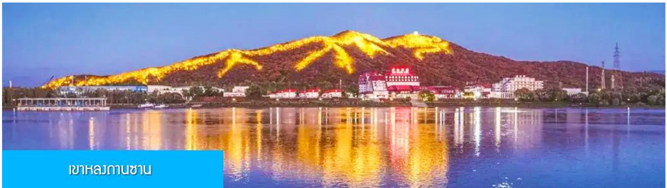
เขาลงถานซาน

หลังอาหารนำท่านผ่านชม วิวยามค่ำของเขา หลงถานซาน 龙潭山夜景 (ผ่านชมระยะไกล) ภูเขารูปทรงคล้ายมังกรในช่วงกลางคืนภูเขาจะถูกประดับด้วยแสงไฟที่สามารถมองเห็นแต่ไกล คล้ายรูปมังกร (บางคนมองว่าคล้ายรูปไดโนเสาร์) จากนั้นนำท่านเดินทางเข้าที่พัก