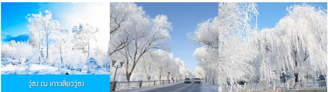
วูซง ณ เกาะสี่วูซง

พักที่ JILIN LUNWEIKE HOTEL โรงแรมระดับ 4 ดาวท้องถิ่นหรือเทียบเท่า ในเมืองจีหลิน