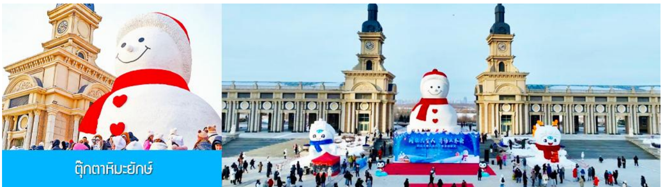
ตุ๊กตาหิมะยักษ์