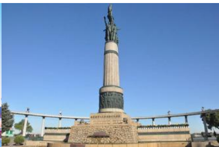
อนุสาวรีย์พิงหว