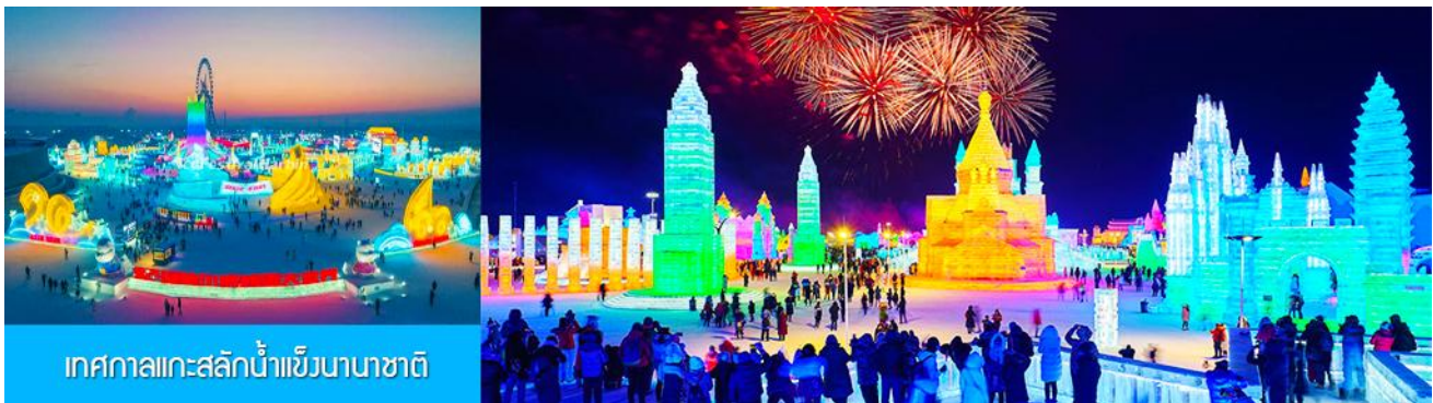
เทศกาลแกะสลักน้ำแข็งนานาชาติ