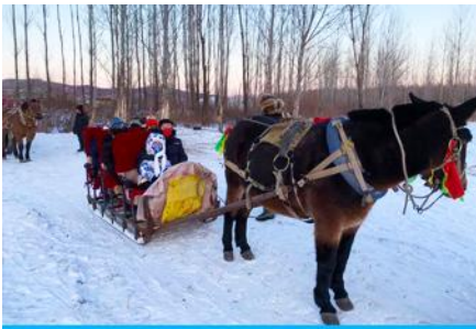
นั่งม้าลากเลื่อน

เที่ยง รับประทานอาหารกลางวัน ณ ภัตตาคาร (3)