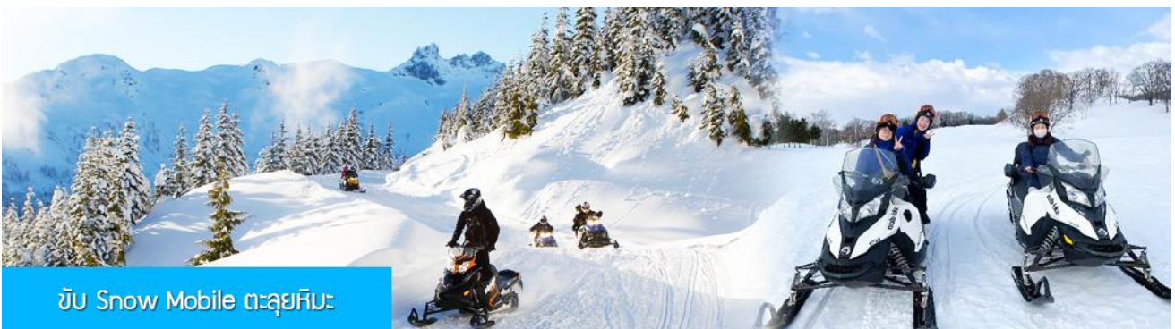
ขับ Snow Mobile ตะลุยหิมะ

ไกด์ท้องถิ่นนำเสนอโปรแกรมเสริม หรือ OPTIONAL TOUR ให้ท่านเลือกตามความสมัครใจ