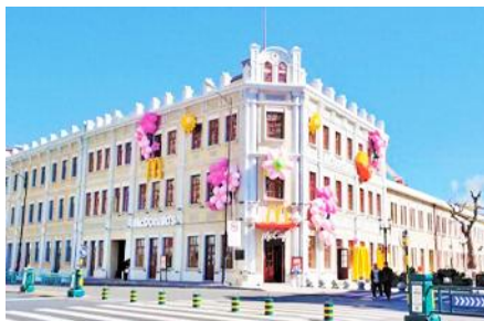
ถนนซินบารอค

พักที่ HARBIN WINTER INN HOTEL โรงแรมระดับ 4 ดาวท้องถิ่น ในเมืองฮาร์บิน