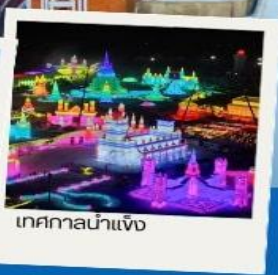
เทศกาลน้ำแข็ง