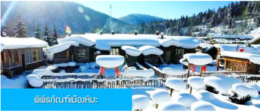
พิพิธภัณฑ์เมืองหิมะ