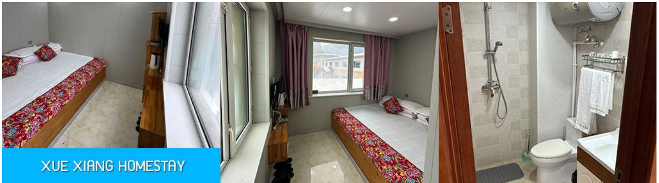
XUE XIANG HOMESTAY