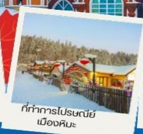
ที่ทำการไปรษณีย์ เมืองหิมะ