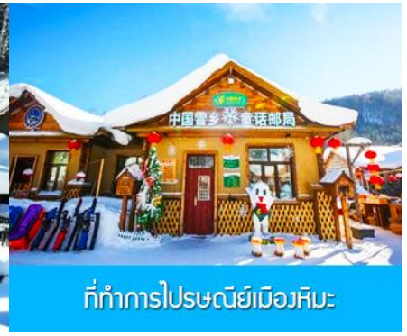
ที่ทำการไปรษณีย์เมืองหิมะ