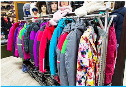
ร้านจำหน่ายอุปกรณ์กันหนาว