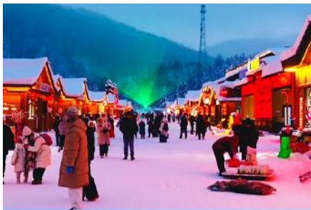
ถนน Xue Yun Jie