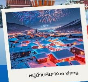
หมู่บ้านหิมะ Xue xiang