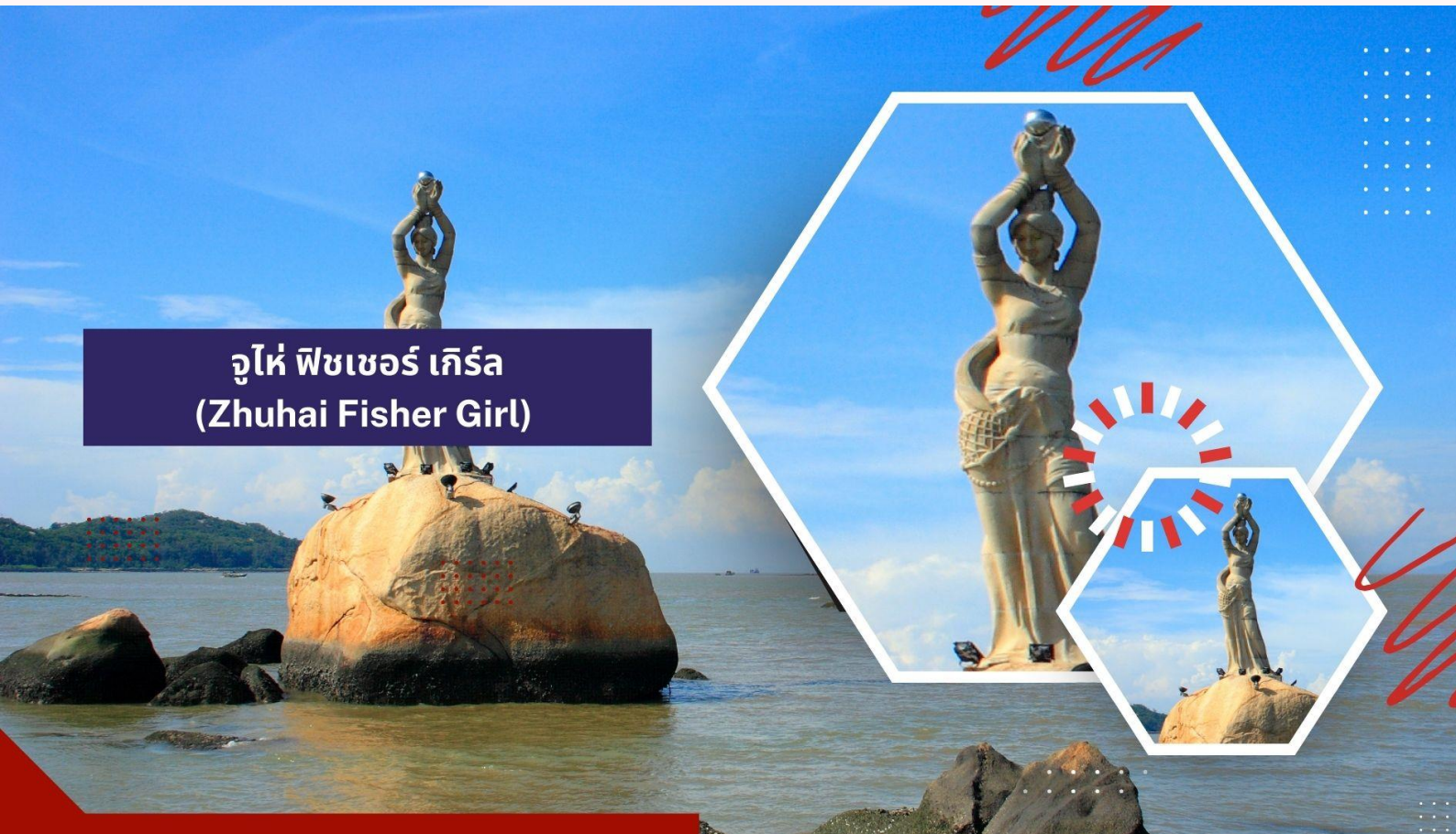
จูไห่ ฟิชเชอร์ เกิร์ล (Zhuhai Fisher Girl)