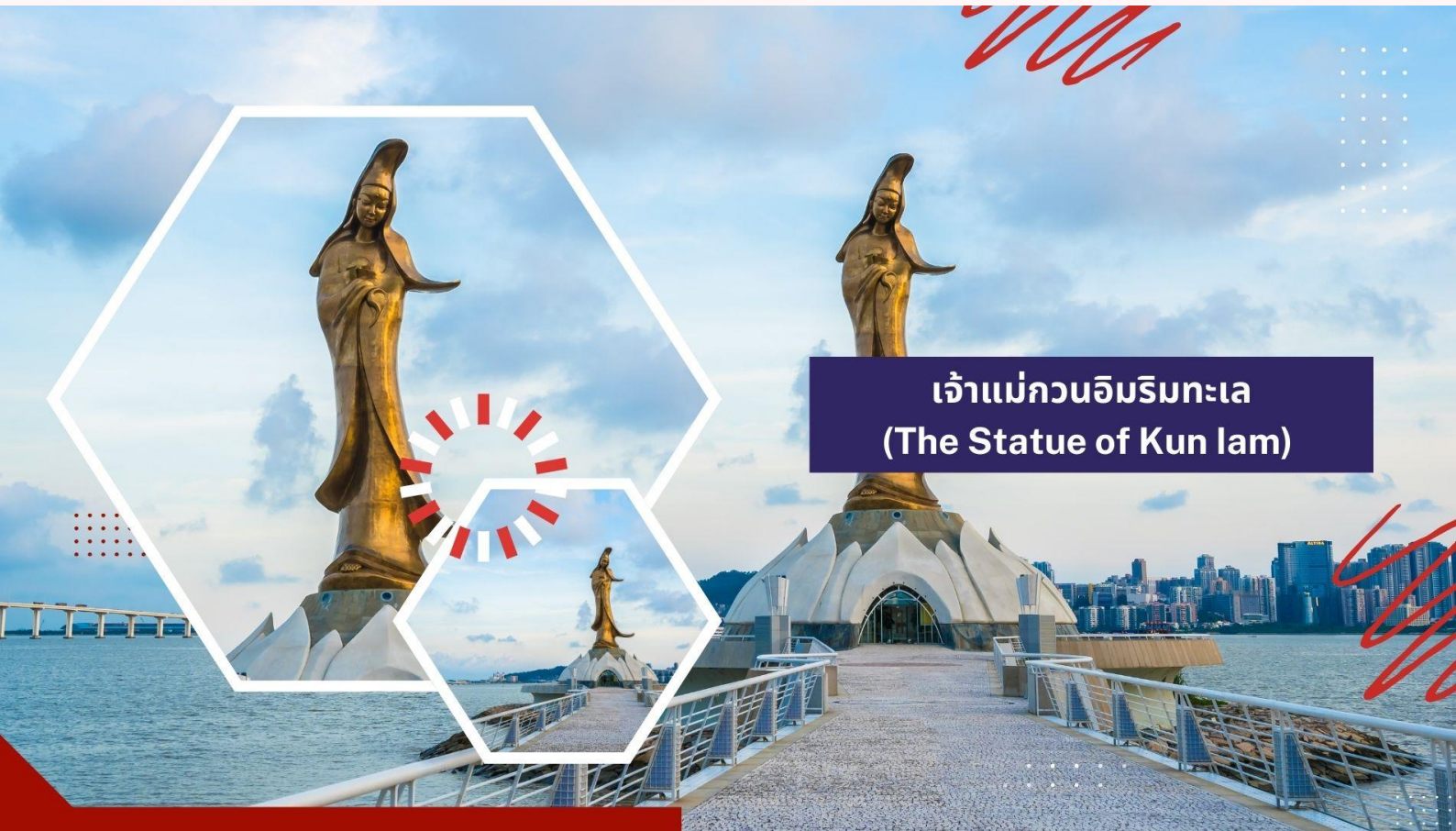
เจ้าแม่กวนอิมริมทะเล (The Statue of Kun Iam)

นำท่านชม เจ้าแม่กวนอิมริมทะเล (The Statue of Kun Iam) เจ้าแม่กวนอิมปรางค์ทองสร้างด้วยทองสัมฤทธิ์ทั้งองค์ มีความสูง 18 เมตร หนักกว่า 1.8 ตัน ประดิษฐานอยู่บนฐานดอกบัวดูงดงามอ่อนช้อย สะท้อนกับแดดเป็นประกายเรืองรองเหลืองอร่ามงดงาม จับตา เจ้าแม่กวนอิมองค์นี้เป็นเจ้าแม่กวนอิมลูกครึ่ง คือ ปั้นเป็นองค์เจ้าแม่กวนอิมแต่ว่ากลับมีพระพักตร์เป็นหน้าพระแม่มารีที่เป็นเช่นนี้ก็เพราะว่าเป็นเจ้าแม่กวนอิมโปรตุเกสตั้งใจสร้างขึ้นเพื่อเป็นอนุสรณ์ให้กับมาเก๊าในโอกาสที่ส่งมอบมาเก๊าคืนให้กับจีน