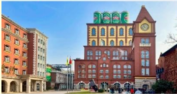
พิพิธภัณฑ์เบียร์ชิงเต่า