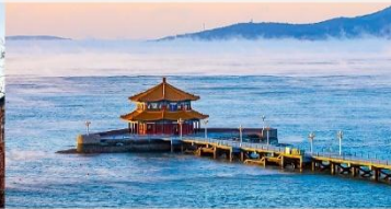
สะพานจันเจียว