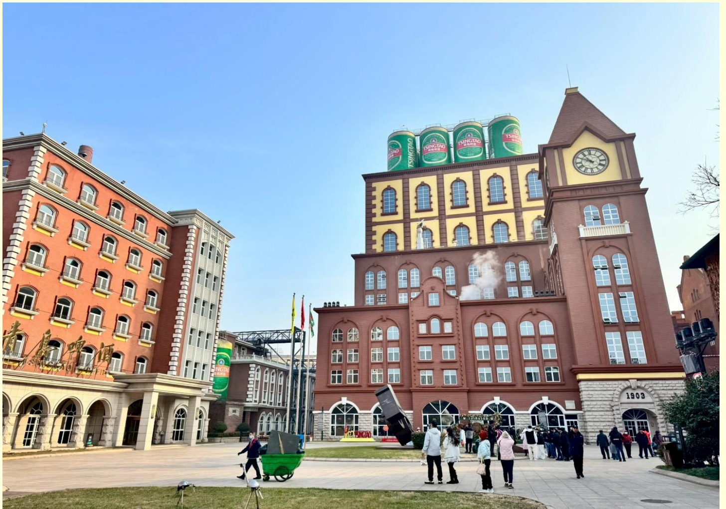
เบียร์สดที่ส่งตรงจากถังหมัก

นำท่านเปิดประตูสู่ตำนานเบียร์ร้อยปีที่ พิพิธภัณฑ์เบียร์ชิงเต่า (ชิมเบียร์ฟรี 1 แก้ว) ก้าวเข้าสู่โลกแห่งฟองเบียร์และประวัติศาสตร์ที่มีชีวิตชีวาที่พิพิธภัณฑ์เบียร์ชิงเต่า ถือเป็นจุดกำเนิดของเบียร์ที่โด่งดังที่สุดของจีน ที่ซึ่งได้รับมรดกทางวัฒนธรรมจากเยอรมันเมื่อปี ค.ศ.1903 ได้ผสมผสานกับวัฒนธรรมจีนอย่างลงตัว เดินย้อนเวลาไปในอาคารอิฐแดงเก่าแก่สไตล์โกธิค สัมผัสกลิ่นหอมของมอลต์และฮอปส์ที่อบอวลไปทั่วพร้อมชมเครื่องจักรต้มเบียร์ทองแดงขนาดยักษ์ที่เคยใช้งานจริง และปิดท้ายทริปด้วยการชิม