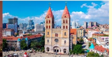
โบสถ์คริสต์เซนต์ไมเคิล

*ทางบริษัทฯ ขอสงวนสิทธิ์ในการสลับโปรแกรมทัวร์ตามความเหมาะสมขึ้นอยู่กับสถานการณ์หน้างาน โดยคำนึงถึงผลประโยชน์ของลูกค้าเป็นสำคัญ