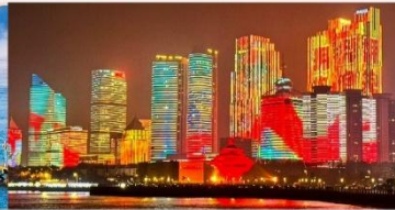
อ่าวฟู่ซาน