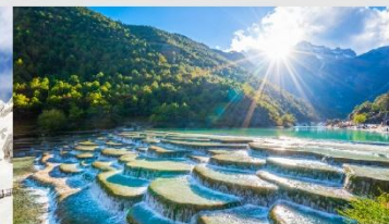
ทะเลสาบไป๋สุ่ยเหอ

*ทางบริษัทฯ ขอสงวนสิทธิ์ในการสลับโปรแกรมทัวร์ตามความเหมาะสมขึ้นอยู่กับสถานการณ์หน้างาน โดยคำนึงถึงผลประโยชน์ของลูกค้าเป็นสำคัญ