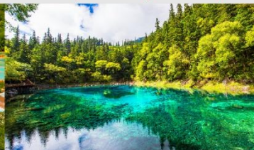
อุทยานแห่งชาติจิวจ้ายโก