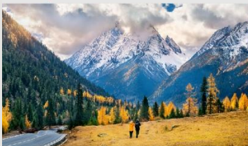
ภูเขาสี่ดรุณี (หุบเขาชวงเฉียวโก)