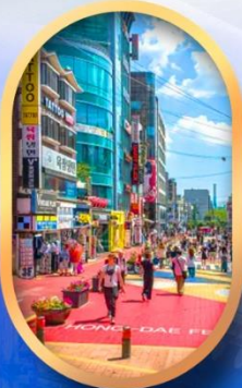
ช้อปปิ้งย่านองแด