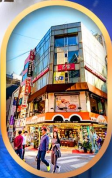
ย่านเมียงดง