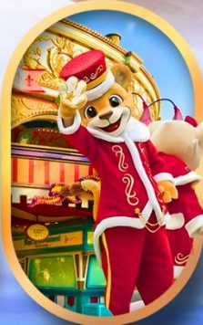
สวนสนุกอเวอร์แลนด์