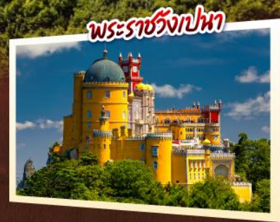
พระราชวังปพา

เข้าชมความงามของ พระราชวังอาลิบราและ-พระราชวังเปนา