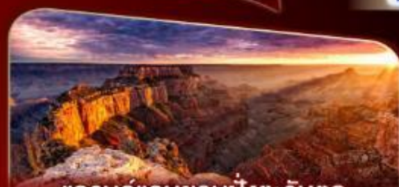
แกรนด์แคนยอนฝั่งตะวันตก

พิกลาสเวกัส 2 คืน เต็มอิ่มกับแสงสีแห่งอเมริกา