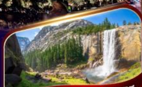
อุทยานแห่งชาติโยเซมิตี