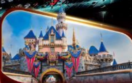
ดิสนีย์แลนด์ปาร์ค