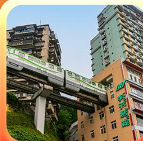
“นั่งรถไฟทะลุตึก”