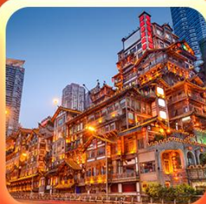
“ล่องเรือชมวิวหงหยาดัง”