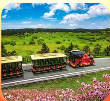
“อุทยานเขานางฟ้า”

บินตรงลงชิง • อยู่หลง หลุมฟ้าสะพานสวรรค์ • ระเบียบแกว • อุทยานเขานางฟ้า หงหยาดัง • นั่งรถไฟทะลุตึก • ล่องเรือชมดวงชิงยามค่ำคืน • ศาลาประชาคม (ด้านนอก) มรดกโลกผาหินแกะสลักต้าจู้ • เมืองโบราณซือปาตี • วัดหลิวฮั่น • ตึกตะเกียบ