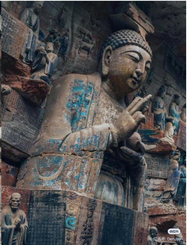
T2G-CKG25FD บินตรงจงชิ่ง...ต้าจู่ อู่หลง อุทยานหลุมฟ้า เหนานางฟ้า 5D 4N (FD)