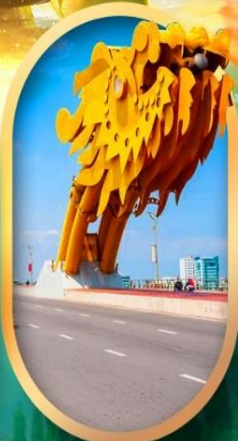
สะพานมังกรดาบิง