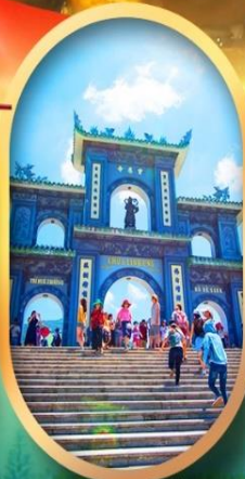
วัดหลินอึ้ง