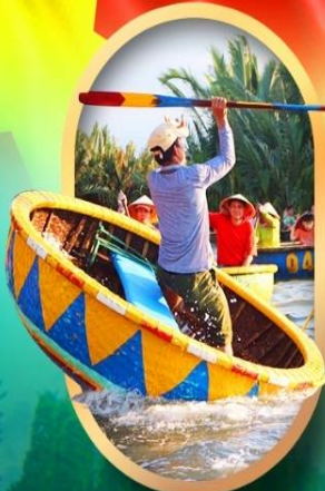
ล่องเรือกระดังง์