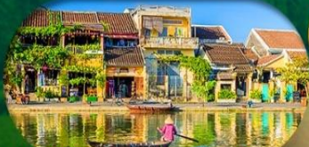
HoiAn Ancient Town ย่านเมืองเก่าฮอยอัน