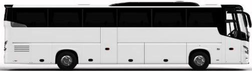
ตัวอย่างรูปภาพรถ 1 ชั้น

หากประเภทห้องที่ท่านริเคอสมาดำเนินการ เช่น ริเคอสห้องพักเป็น TWIN BED หรือ DOUBLE BED ทางบริษัทขอสงวนสิทธิ์ในการปรับประเภทห้องพัก เป็น ตามที่โรงแรมมีอยู่ โดยไม่ต้องแจ้งให้ทราบล่วงหน้า