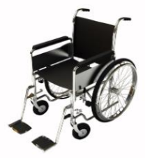
การรับบริการดูแลเป็นพิเศษ

กรณีผู้เดินทางต้องการความช่วยเหลือเป็นพิเศษ อาทิเช่น การใช้วีลแชร์ กรุณาแจ้งบริษัทฯ อย่างน้อย 7 วันก่อนการเดินทาง มิฉะนั้นบริษัทฯ จะไม่สามารถจัดการล่วงหน้าได้ เนื่องจากการขอใช้วีลแชร์ในสนามบินนั้น ต้องมีขั้นตอนในการขอล่วงหน้า และบางสายการบินอาจมีการเรียกเก็บค่าใช้จ่ายทั้งทางสนามบินในไทยและในต่างประเทศ ซึ่งผู้เดินทางสามารถสอบถามกับเจ้าหน้าที่ได้โดยตรงก่อนทำการจอง และหากในขณะของท่านมีผู้ต้องการดูแลพิเศษ เช่น ผู้ที่นั่งรถเข็น (Wheelchair), เด็ก, ผู้สูงอายุและผู้ที่มีโรคประจำตัวหรือไม่สะดวกในการเดินทางท่องเที่ยวในระยะเวลาเกินกว่า 4 - 5 ชั่วโมงติดต่อกัน ท่านและครอบครัวต้องให้การดูแลสมาชิกภายในครอบครัวของท่านเอง เนื่องจากการเดินทางเป็นหมู่คณะ หัวหน้าทัวร์มีความจำเป็นต้องดูแลคณะทัวร์ทั้งหมด