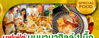
บุฟเฟต์ บันบานาฮิลล์ 1 มื้อ และ บุฟเฟต์ บาบีคิวปิ้งย่าง เดินทาง มี.ค. - ต.ค. 69