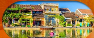
HoiAn Ancient Town ย่านเมืองเก่าฮอยอัน

เวียดนามกลาง ดานัง ฮอยอัน เที่ยวบานาฮิลล์