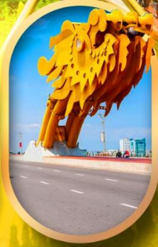
สะพานมังกรคานัง