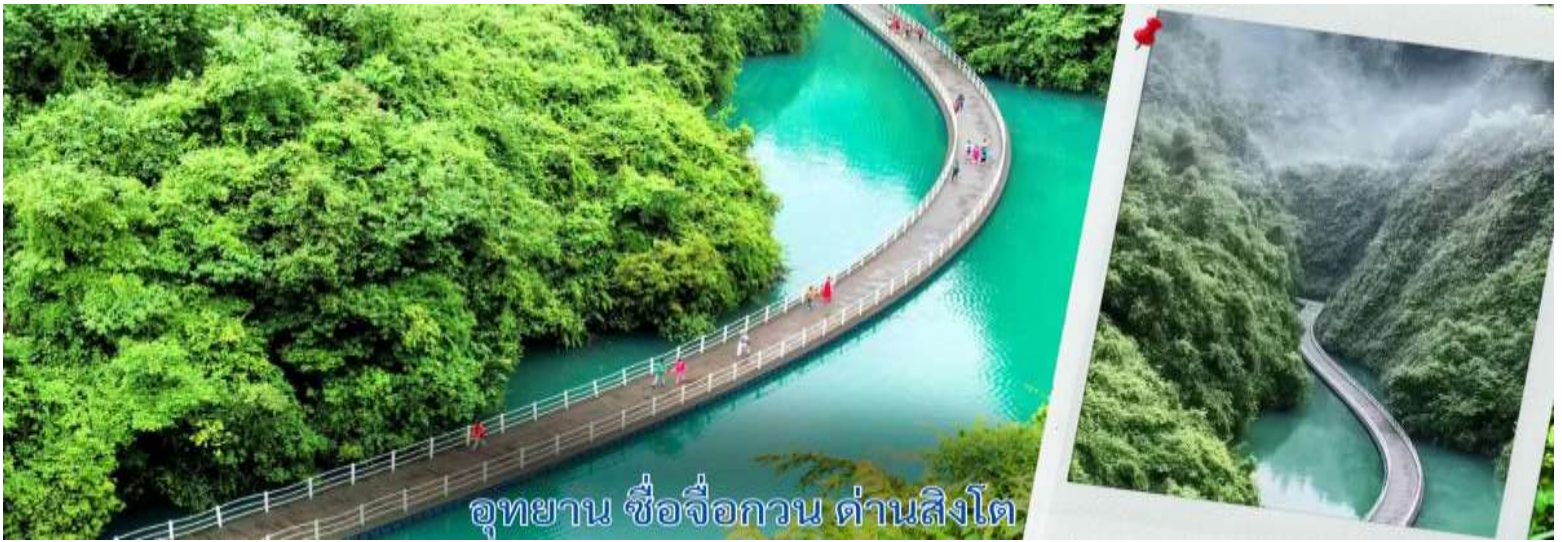
อุทยาน ชื่อจื่อกวน ด้านสิงโต