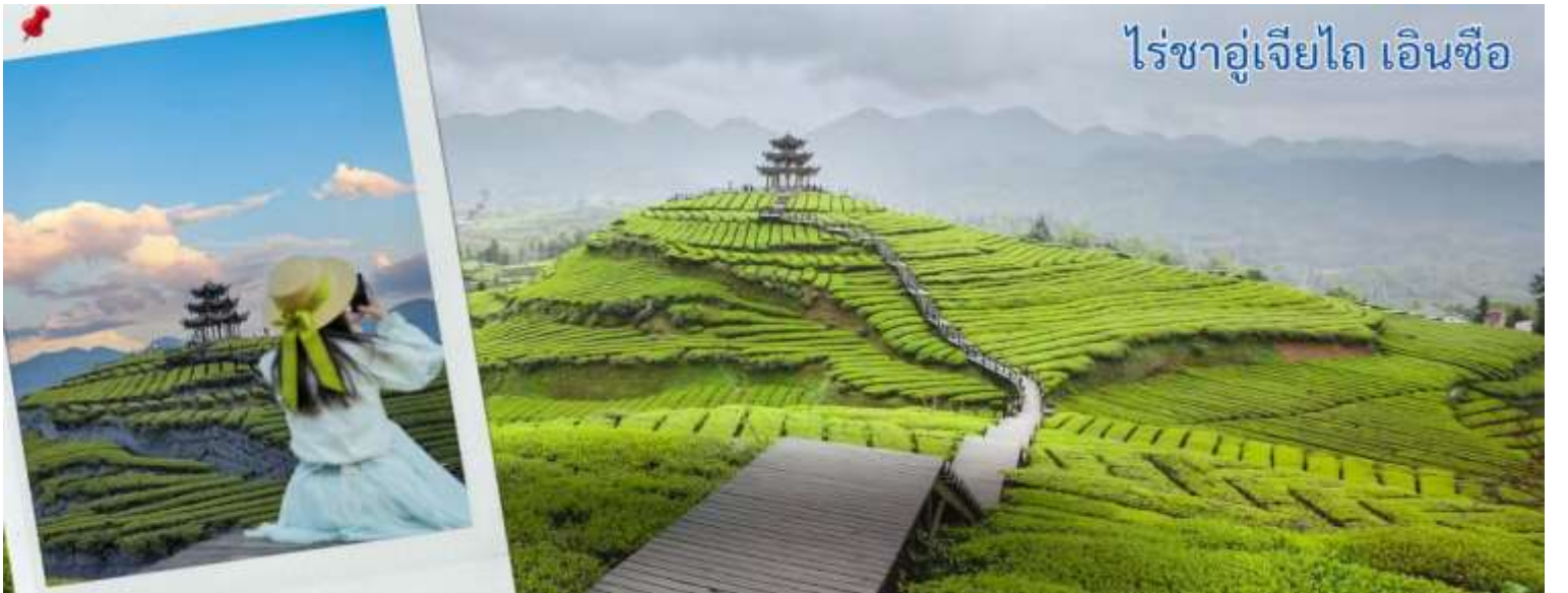
ไร่ชาอู่เจียไถ เอินซือ

หลังจากรับประทานอาหารกลางวัน นำทุกท่านเดินชม ภูเขาใบชาอู่เจียไถ คือแหล่งมรดกโลกที่ตั้งอยู่ในเขตภูเขา มณฑลชานซี ประเทศสาธารณรัฐประชาชนจีน เป็นหนึ่งในสี่ภูเขาอันศักดิ์สิทธิ์ทางพุทธศาสนาของจีน ณ ภูเขาอู่ไถแห่งนี้เป็นที่ประทับของพระมัญชุศรีโพธิสัตว์ ธรรมราชากุมารในคติของพระพุทธศาสนาหายาน ได้รับการจัดระดับโดยคณะกรรมการจัดระดับคุณภาพสถานที่ท่องเที่ยวแห่งประเทศไทยระดับ 5A เมื่อปี 2550 ภูเขาใบชาอู่เจีย ตั้งอยู่ในเขตชวนเอน มณฑลหูเป่ย์ ประเทศจีน เป็นแหล่งผลิตชาคุณภาพสูงที่มีชื่อเสียง โดยเฉพาะชา กังฉา ซึ่งเคยเป็นชาชั้นสูงที่ถวายแต่ฮ่องเต้ในอดีต แม้ว่าข้อมูลในวิกิพีเดียภาษาไทยจะเน้นไปที่เขาผู้ถั่ว (ที่ประทับพระแม่กวนอิม) หรือเขาอู่ไถ (หนึ่งในสี่ภูเขาศักดิ์สิทธิ์) แต่ อู่เจียไถ เป็นที่รู้จักในฐานะไร่ชาที่มีทิวทัศน์สวยงามและผลิตชาชั้นดี มีการจำหน่ายและให้ชิมชาชาว ชาเขี้ยว และชาท้องถิ่น