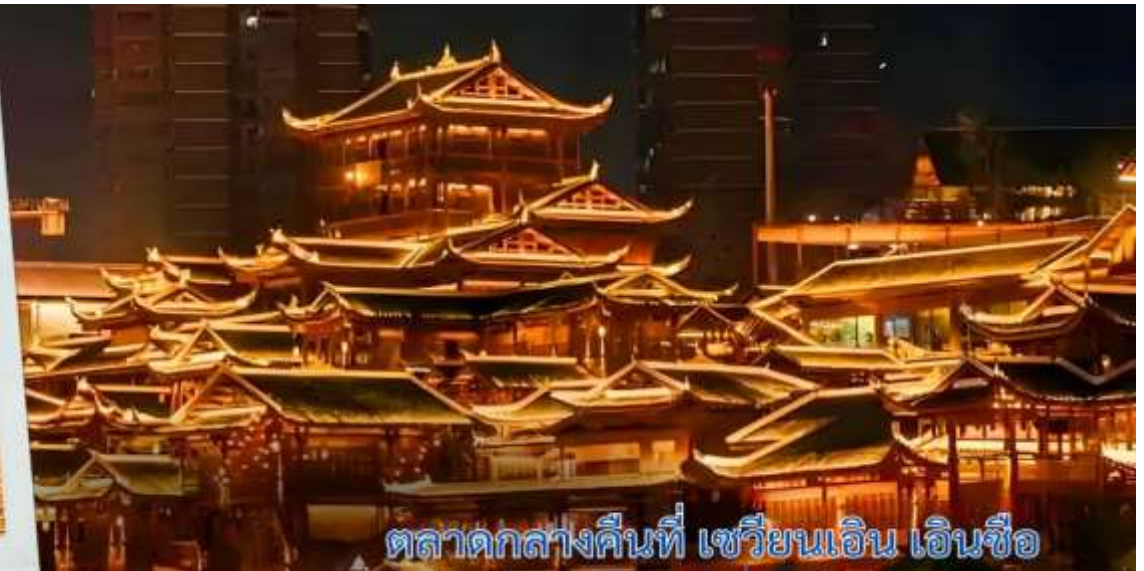
ตลาดกลางคืนที่ เซวียนเอน เอินซือ