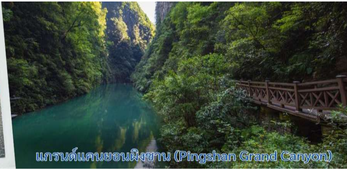
แกรนด์แคนยอนผิงซาน (Pingshan Grand Canyon)