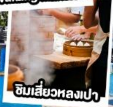
ชิมเสี่ยวหลงเปา