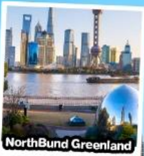
North Bund Greenland