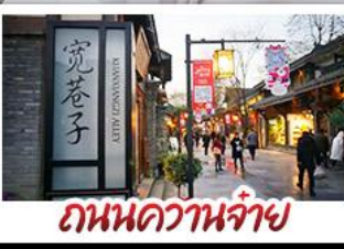
ถนนควานจ่าย