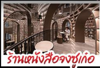
ร้านหนังสือจ้งซู่เก้อ

อุทยานภูทาสี่ครุณี อุทยานบึงฝั่งทิว หมี่เพนตันอนแซลฟี ร้านหนังสือจ้งซู่เก้อ วัดต้าฉือ ถนนโบราณควนจ่าย ซ้อบั้งย่านคัง ถนนไท่กู่หลี่ + ถนนซุนซี้ซู่ เมนูพิเศษ สุกี้หมาล่าเสฉวน