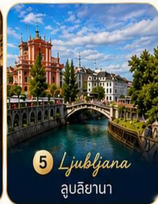
5 Ljubljana ลูบลียานา