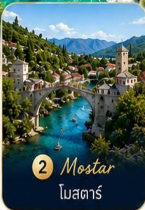
2 Mostar โมสตาร์