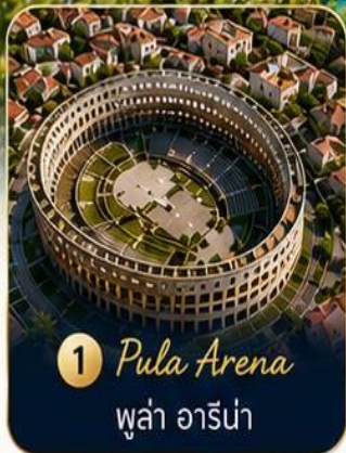
1 Pula Arena พูล่า อารีน่า