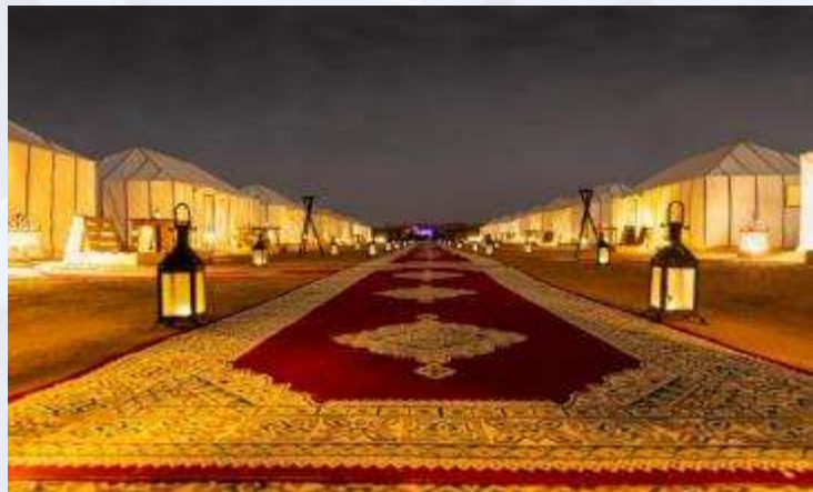
ค่ำ บริการอาหารมื้อค่ำ ณ ห้องอาหารของโรงแรมที่พัก

พักที่: KASBAH YASMINA CAMP, SAHARA DESERT LUXURY CAMP / หรือที่พักระดับใกล้เคียง