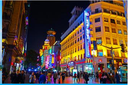
ถนนคนเดินหนานจิงลู่

หลังอาหารนำท่านเดินทางสู่ นครเซี่ยงไฮ้ 上海 (ระยะทาง 210 กม. ใช้เวลาเดินทางราว 3 ชั่วโมง)