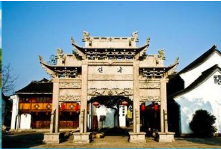
เมืองโบราณ หลู่จี้