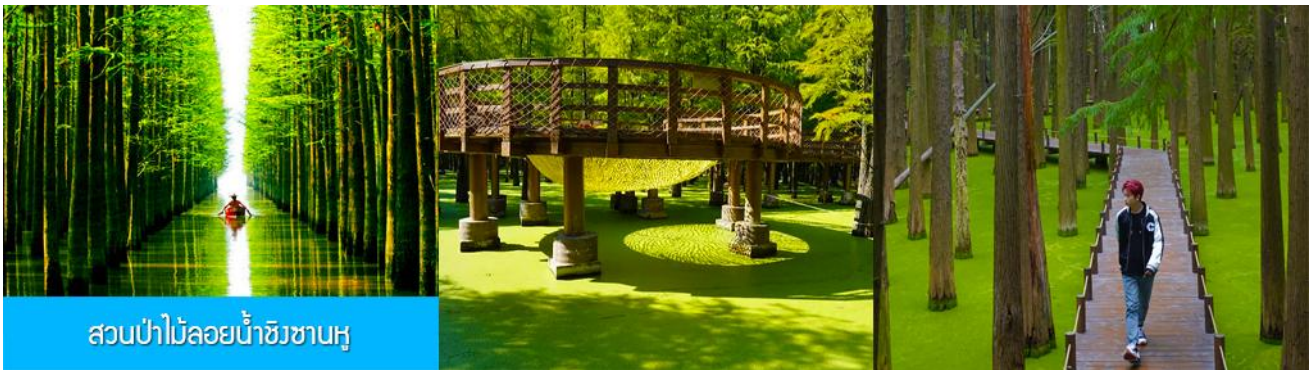
สวนป่าไผ่ลอยน้ำชิงชานหู