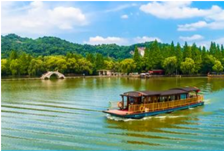
ล่องเรือทะเลสาบเจียนหู