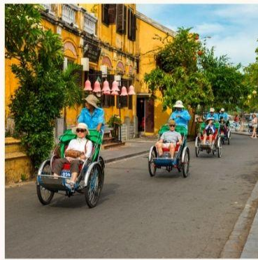
นั่งสามล้อชมเมือง