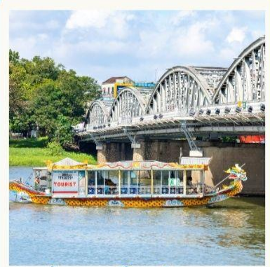
ล่องเรือมังกร แม่น้ำหอม