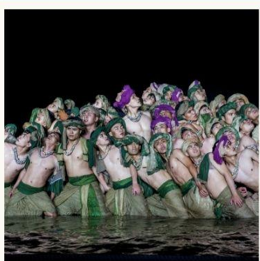
ชมโชว์ Hoi An Memories