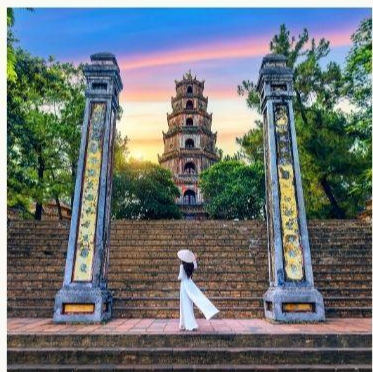
วัดเทียนมู่