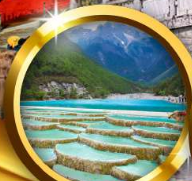
ทะเลสาบไ้สยเห่อ