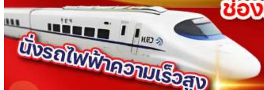
นั่งรถไฟฟ้าความเร็วสูง