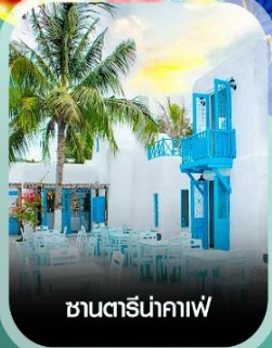
ซานตารีน่ากาเฟ