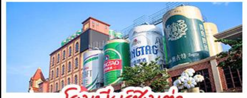
โรงเบียร์ชิงเต่า