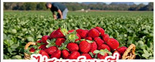
ไร่สตรอว์เบอร์รี่

คฤหาสน์หวินเจิง - สวนซากุระชิงเต่า ไร่สตรอเบอร์รี่ - โรงเบียร์ชิงเต่า