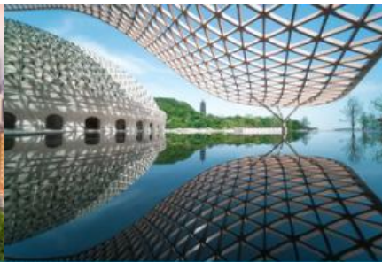
อุทยานกุ่มกี่ยวหวินวี่ส่วซาน