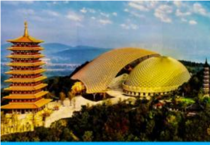
อุทยานหนิวสั่วซาน