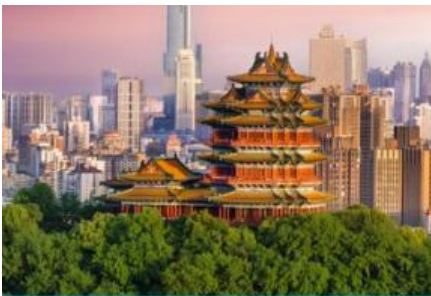
นครนานกิง