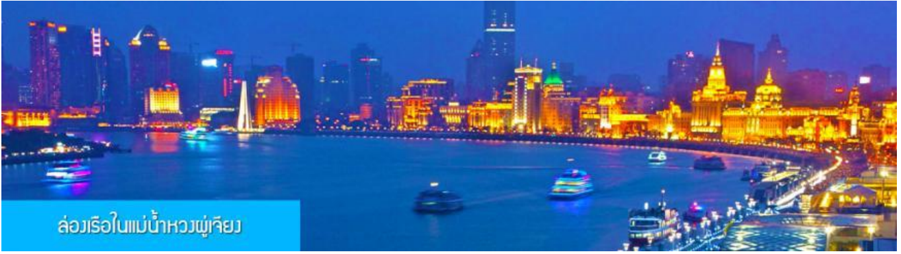
ล่องเรือในแม่น้ำหวงผู่เจียง