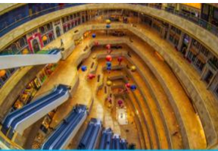
จตุรัสเต๋อจี

พักที่ โรงแรม Holiday Inn Express Dongshan Hotel 4* หรือเทียบเท่าในนครหนานจิง