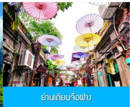
ย่านเกียบจื่อฝาง