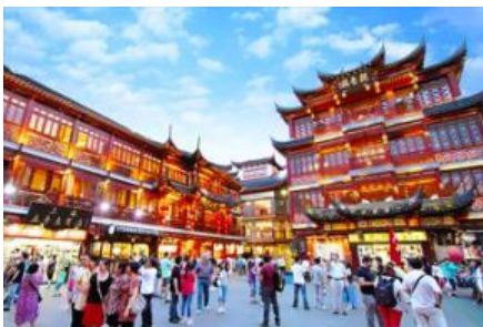
ตลาดร้อยปีฉงหวงเหมียว

พักที่ โรงแรม Holiday Inn Express Hotel 4* หรือเทียบเท่าในนครเซี่ยงไฮ้