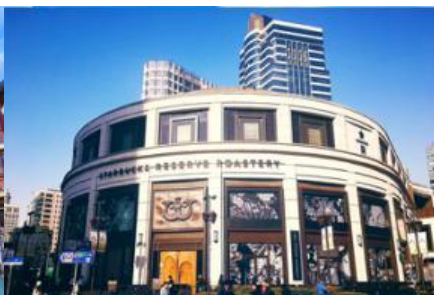
Starbuck Reserve Roastery