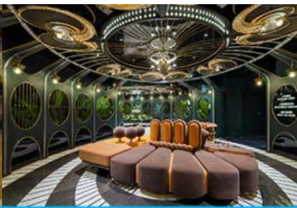
ห้องน้ำไอเทค