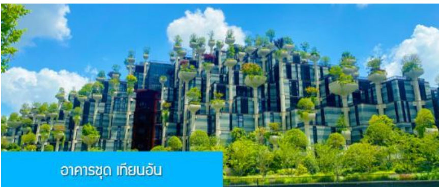
อาคารชุด เทียนอัน

เที่ยง รับประทานอาหารกลางวัน ณ ภัตตาคาร (6)