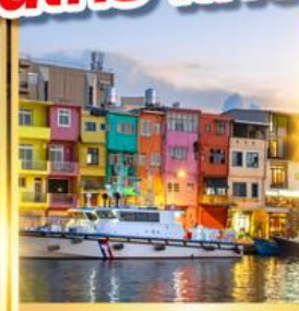
ท่าเรือประมงเจี๋ยปิง