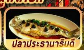
ปลาประรานาภิรมดี