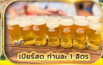
เบียร์สด ท่านละ 1 สิตร