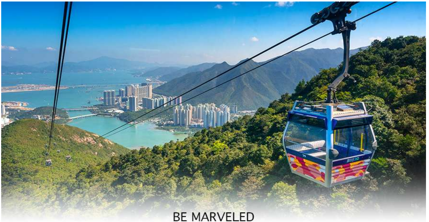
BE MARVELED กระเช้ามองปีง

ของอุทยานบนเกาะลันเตาเหนือ ถือได้ว่าเป็นแหล่งท่องเที่ยวอันมีเอกลักษณ์ระดับโลกของฮ่องกง (**กรณี กระเช้ามองปีง 360 มีการปิดซ่อมบำรุง หรือ มีการปิดเนื่องจากสภาพอากาศแปรปรวน ทางบริษัทฯ ขอสงวน สิทธิ์ในการเปลี่ยนเป็นใช้รถโค้ชของทางอุทยานในการเดินทาง เพื่อนำท่านขึ้นสู่หมู่บ้านวัฒนธรรมมองปีง บน เกาะลันเตาแทน**) จากนั้นนำท่านไปสักการะ (พระใหญ่เกาะลันเตา หรือ พระพุทธรูปเทียนถาน (TIAN TAN BUDDHA STATUE))