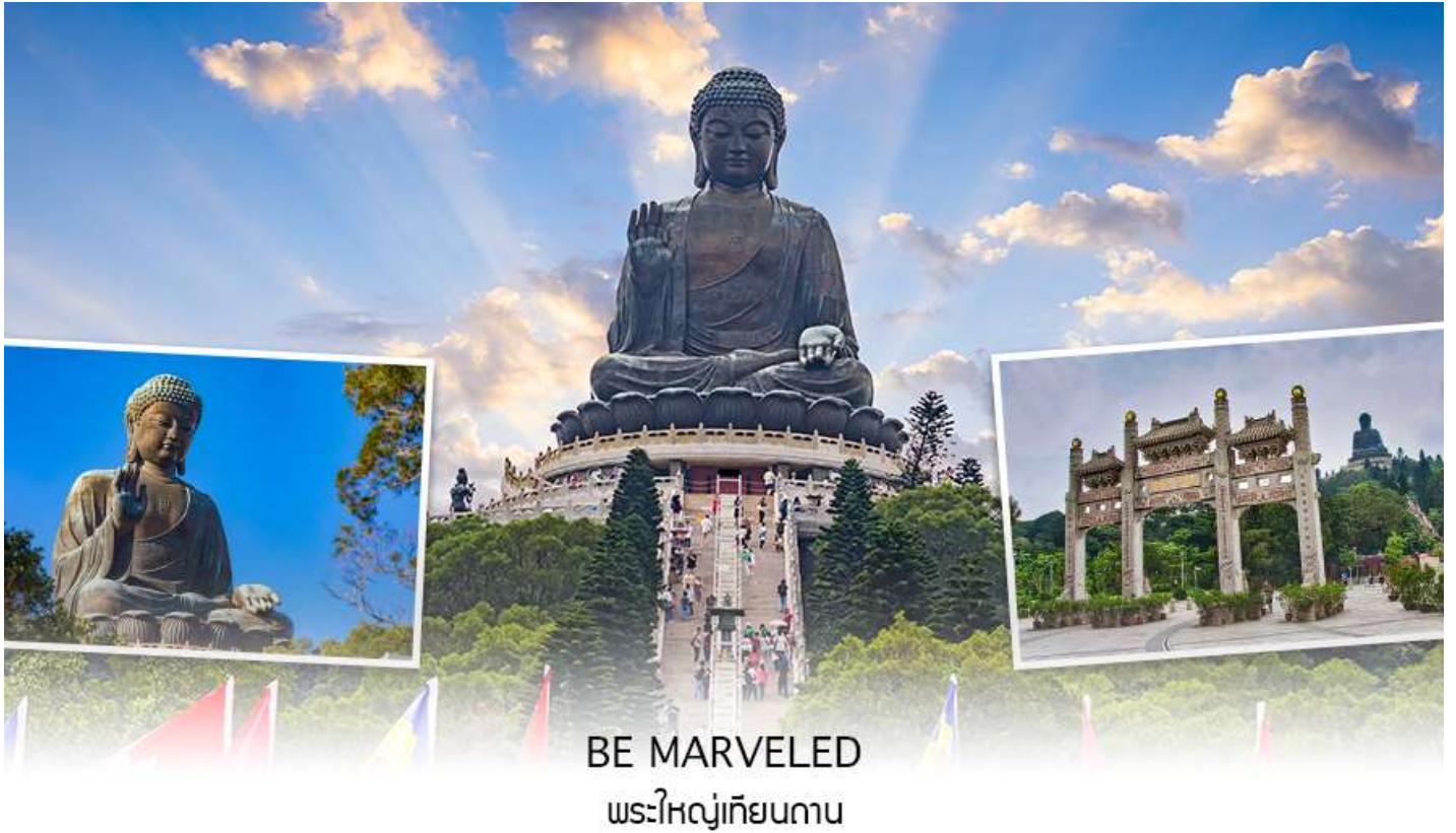
BE MARVELED พระใหญ่เทียนถาน

องค์พระใหญ่แห่งนี้แล้ว ชีวิตก็จะมีแต่ความ โชคดี มีความสุขสมหวัง และประสบความสำเร็จในทุกๆด้าน หลังจากไหว้พระแล้วท่านสามารถเลือกซื้อของฝาก, ของที่ระลึก จากหมู่บ้านนงปิง อาทิเช่น หยก ไข่มุก หรือ เครื่องประดับคริสตัล เพื่อเป็นของที่ระลึก จากนั้นนั่งกระเช้ากลับลงมายังสถานีตุงซุง