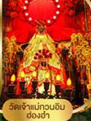
วัดเจ้าแม่กวนอิม ย่องซ่า