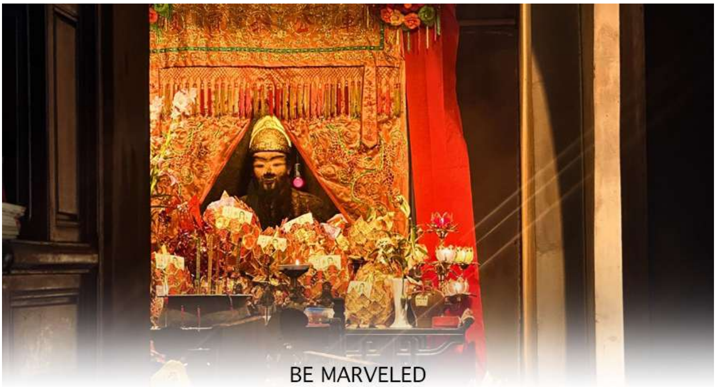
BE MARVELED วัดแซง อนุรักษ์ 600 ปี

ถึง 600 ปี แล้วยังเป็นเพราะเป็นวัดแซงดั้งเดิม เป็นวัดแซงแห่งแรกที่สร้างขึ้นเพื่อบูชาเทพเจ้าแซง ซึ่งคือแม่ทัพแซงวีรบุรุษผู้กล้าหาญและซื่อสัตย์จากสมัยราชวงศ์ซ่งใต้ (ค.ศ. 1127-1279) ซึ่งได้รับการยกย่องจากฮ่องเต้จากวีรกรรมในการปราบกบฏทางตอนใต้ของจีน สาเหตุที่วัดแซงถูกสร้างขึ้นที่นี่ เพราะมีตำนานเล่าว่า ท่านแม่ทัพแซงได้ให้การคุ้มครองจักรพรรดิเจ้าปิง องค์จักรพรรดิองค์สุดท้ายของราชวงศ์ซ่งใต้ ระหว่างการเสด็จหนีลงใต้มาตั้งหลักแหล่งที่นี่ก่อนราชวงศ์จะล่มสลาย ด้วยความซื่อสัตย์และความกล้าหาญเป็นที่ประจักษ์ ชาวบ้านจึงเริ่มบูชาแม่ทัพแซงหลังจากท่านเสียชีวิตลง