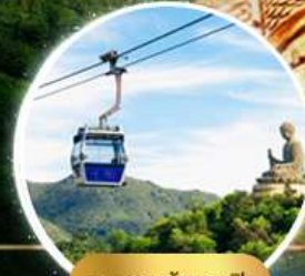
รวมกระเช้าฮ่องกง