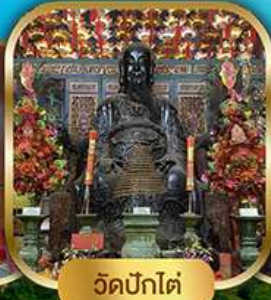
วัดปึกใต้