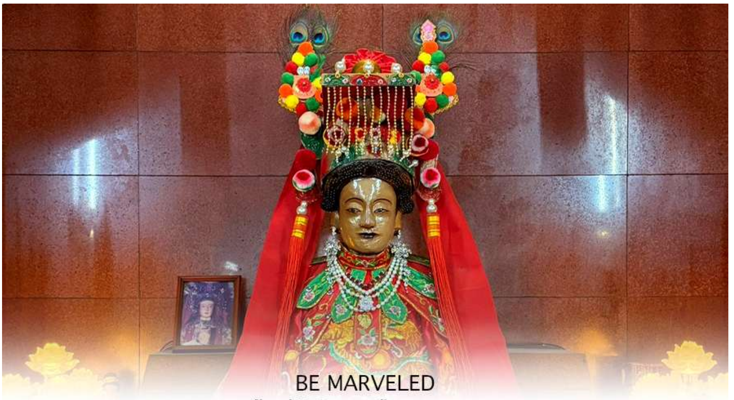
BE MARVELED เจ้าแม่ทับทิม 400ปี Yuen Long

หลังจากนั้นนำทุกท่านเดินทางไปยัง วัดเจ้าแม่ทับทิม 400 ปี เจ้าแม่ทับทิม ผิงซาน – Yuen Long (Ping Shan Tin Hau Temple) อยู่บน Ping Shan Heritage Trail เส้นทางมรดกทางวัฒนธรรมที่สำคัญของฮ่องกง วัดนี้สร้างขึ้นประมาณ ค.ศ. 1712 (สมัยราชวงศ์ชิง) มีอายุมากกว่า 300 ปี และในความเชื่อของชุมชนท้องถิ่นมักเรียกกันว่า วัดเจ้าแม่ทับทิม 400 ปี เพื่อสื่อถึงความเก่าแก่และการบูชาต่อเนื่องหลายชั่วอายุคน สร้างโดยตระกูล Tang Clan หนึ่งใน 5 ตระกูลใหญ่ดั้งเดิมของ New Territories ได้รับการขึ้นทะเบียนเป็น Declared Monument (โบราณสถานสำคัญของฮ่องกง) เจ้าแม่ทับทิม Tin Hau เทพีแห่งทะเล การเดินทาง ความปลอดภัย และความอุดมสมบูรณ์ ชาวประมง พ่อค้า นักเดินทาง นิยมมาขอพรเรื่องความปลอดภัย การค้าขาย ครอบครั้ว และ สุขภาพ