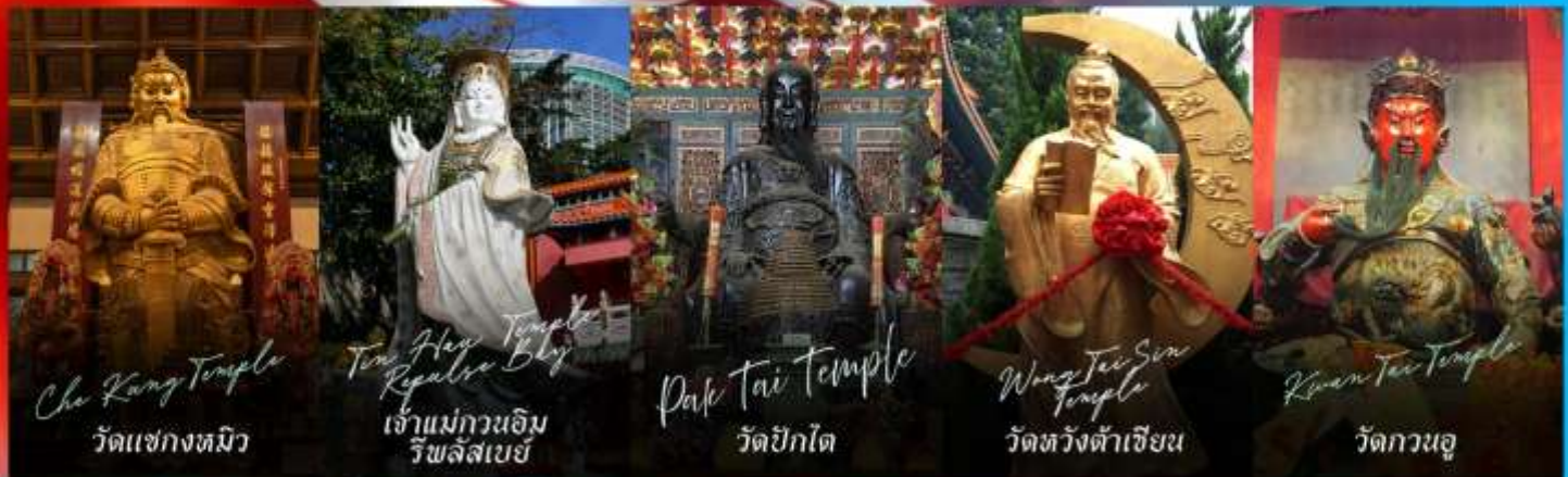
Che Kung Temple วัดเข่งกวมิว

รายการทัวร์ข้างต้นอาจมีการปรับเปลี่ยนเพื่อความเหมาะสม