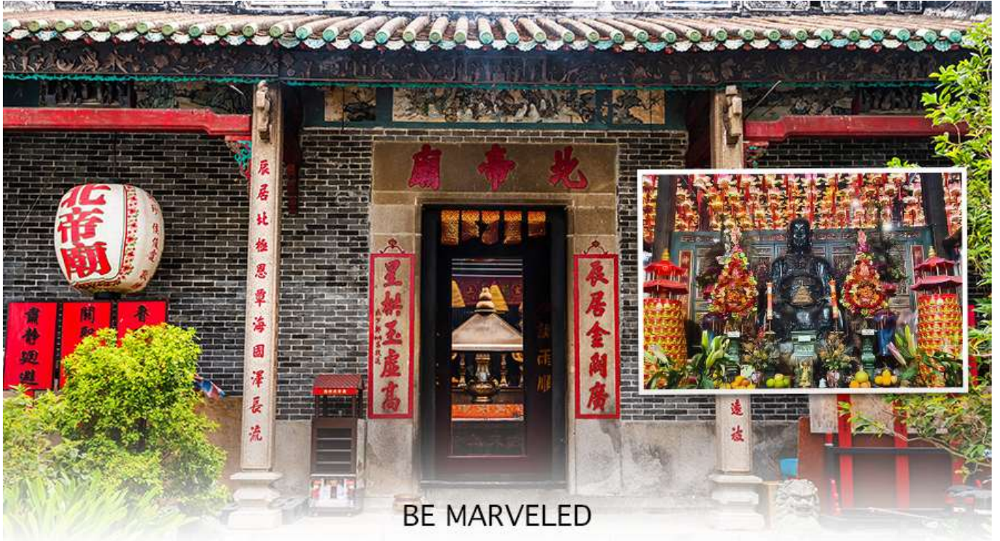
BE MARVELED วัดปักไต้

คนที่เป็นศัตรูของ เราเปลี่ยนใจมาเป็นมิตร เป็นที่นิยมอย่างมากของชาวท้องถิ่นฮ่องกงมาราบไหว้ขอพรกันที่วัด